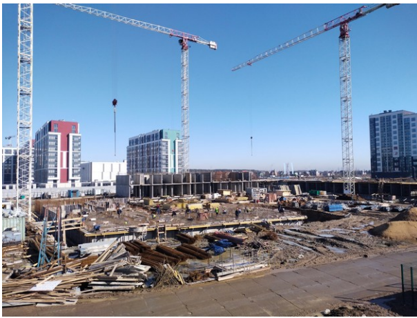
Строительная площадка корпуса