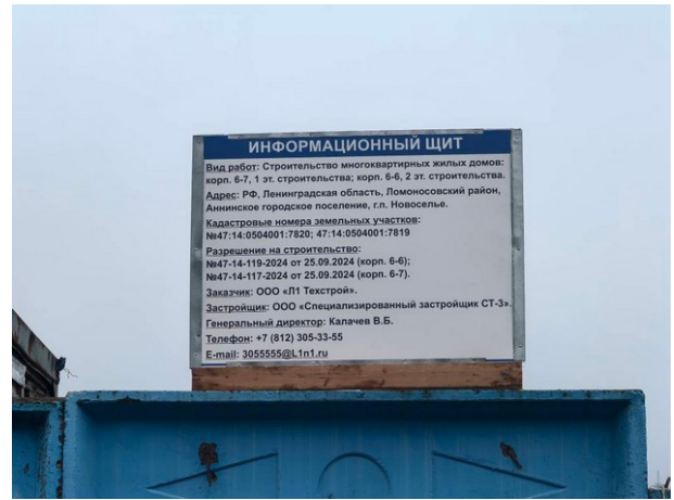
Информационный щит объекта