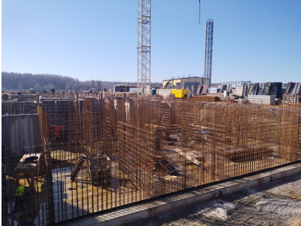
Армирование стен подвального этажа