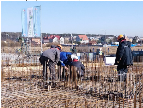
Армирование стен первого этажа