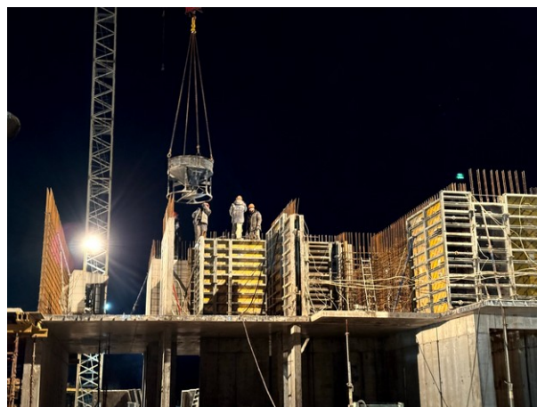
Бетонирование стен второго этажа