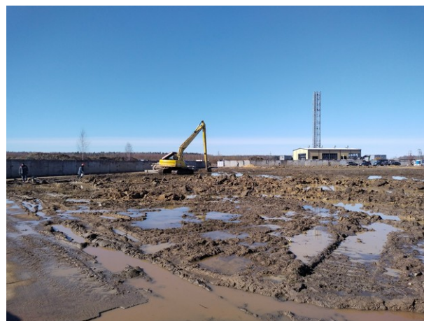
Строительная площадка корпуса