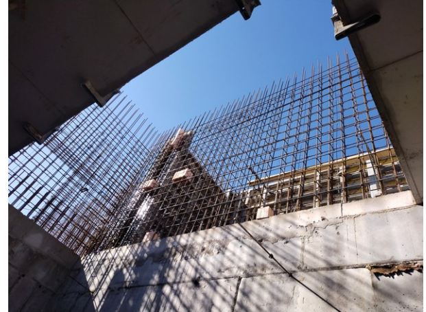
Армирование стен первого этажа