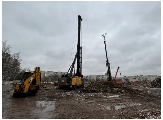
Подготовка армированного каркаса для бетонирования конструкций забивания свай