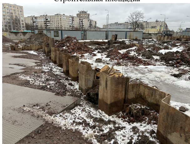
Шпунтовое ограждение котлована