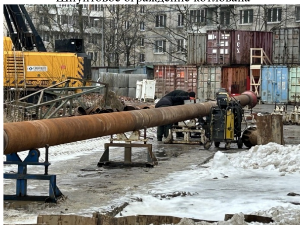
Подготовка труб для бурения отверстий