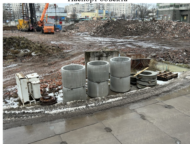
Подготовительные работы для устройства НВК